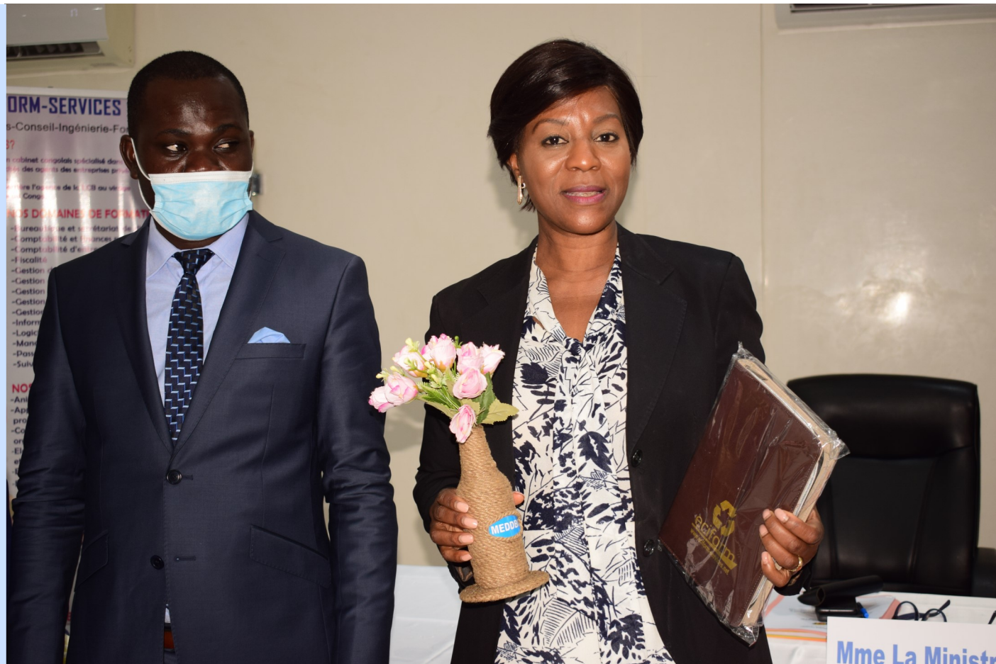
Mme la Ministre de l'Environnement du Congo Brazzaville & le DG du Cabinet ECIFORM